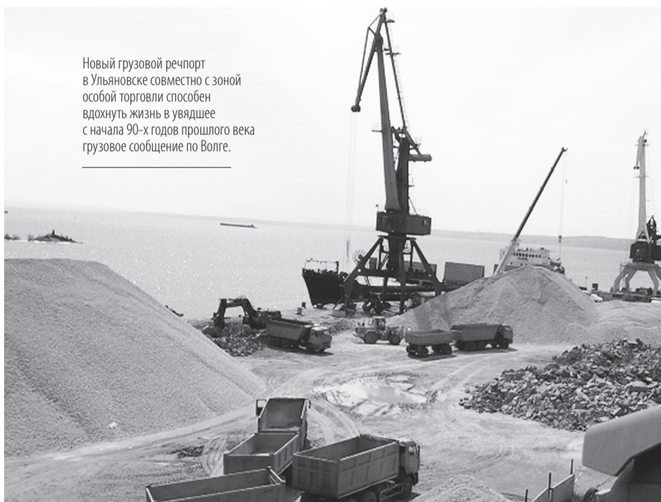
Новый грузовой речпорт в Ульяновске совместно с зоной особой торговли способен вдохнуть жизнь в увядшее с начала 90-х годов прошлого века грузовое сообщение по Волге.

Мультимодальный контейнерный порт для перевалки грузов между железнодорожным, автомобильным и речным транспортом расположится на участке, не-